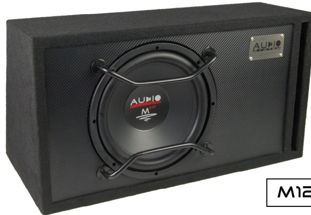
M12 EVO BR